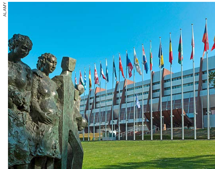
Europarat, Strassburg: Studenten willkommen